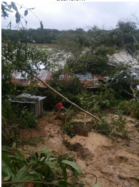
Afectación Cartagena del Chairá, Caquetá

Bogotá, 6 de abril de 2016. (@UNGRD.) La Unidad Nacional para la Gestión del Riesgo de Desastres mantiene su llamado a los colombianos para que mantengan atención en aquellas zonas donde es más probable que se registren complicaciones por las lluvias que se presentan en el país.