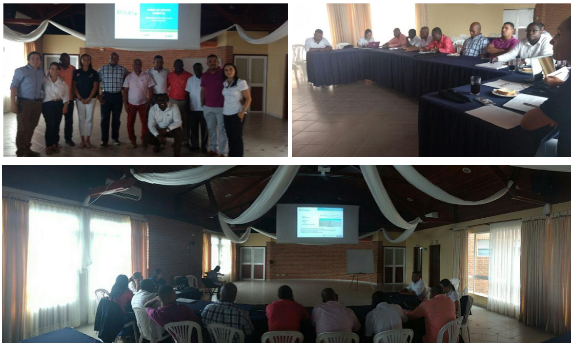
Foto 1 Registro fotográfico Consulta Pública, Tumaco (Nariño) junio 14 de 2017