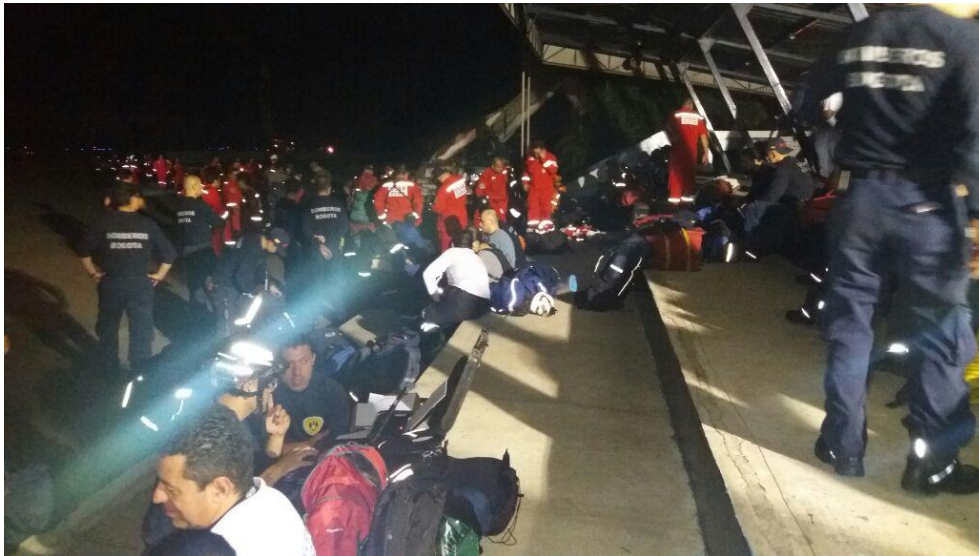
Imagen No 2 Movilización del equipo USAR COL-1 Arribo Aeropuerto Internacional Eloy Alfaro Manta Ecuador

A las 7 pm, hizo arribo el equipo USAR COL1, a la ciudad de Manta Ecuador. Allí pasamos por migración y el Centro de Registro y Despacho "RDC" en cabeza de bomberos Quito, quienes nos asignaron a la ciudad de Portoviejo, iniciamos desplazamiento una vez nos suministraron camión y buses.