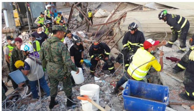
Imagen 10. Labores de Búsqueda y Rescate Servipagos Portoviejo Ecuador