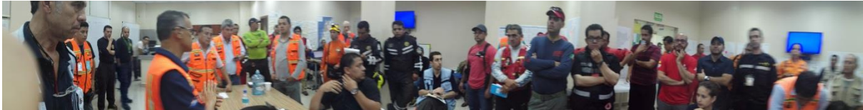
Imagen No 5 Reunión SGR Ecuador-Célula de Coordinación USAR OSOCC Portoviejo

Las actividades de coordinación de equipos USAR nacionales e internacionales, consistieron en la compilación de la información de campo, la sectorización de las zonas de intervención, las asignaciones a cada uno de los equipos. Colombia estuvo a cargo de la célula de coordinación USAR CCU desde el momento de arribo el 17 de abril y se hizo empalme con Equipo de UNDAC el día 21, pero continuamos apoyando la labor hasta el para entregar hasta el día Jueves 21