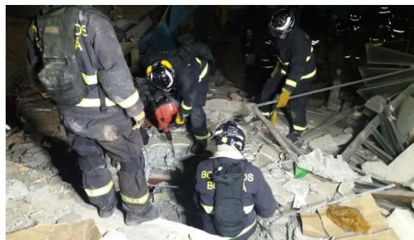
Imagen 9. Rescate de Pablo Córdova Cañizares