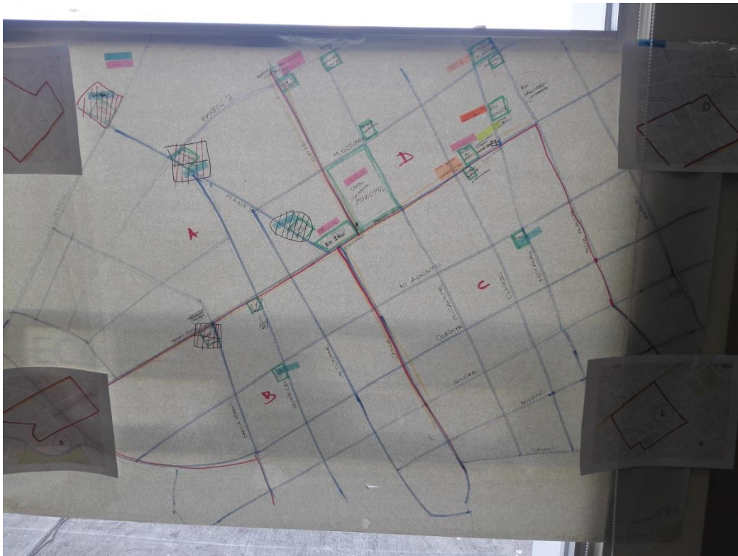
Imagen No 4 Plano sectorización inicial Portoviejo

El Equipo USAR COL-1 siendo el primer equipo internacional en arribar al COE Ecuador, realiza la instalación provisional del Centro de Coordinación de Operaciones en Sitio "OSOCC" provisional, en conjunto con el Sistema Integrado de Seguridad ECU-911 de Portoviejo, provincia de Manabí. Se inicia labores de consolidación de ASR-1 y asignación a los equipos, para ASR-2 y ASR-3