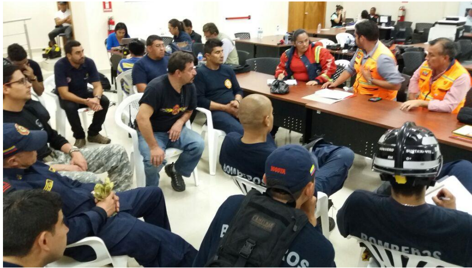
Imagen No 3 Reunión de Coordinación con la Secretaria de Gestión del Riesgo de Ecuador (LEMA)