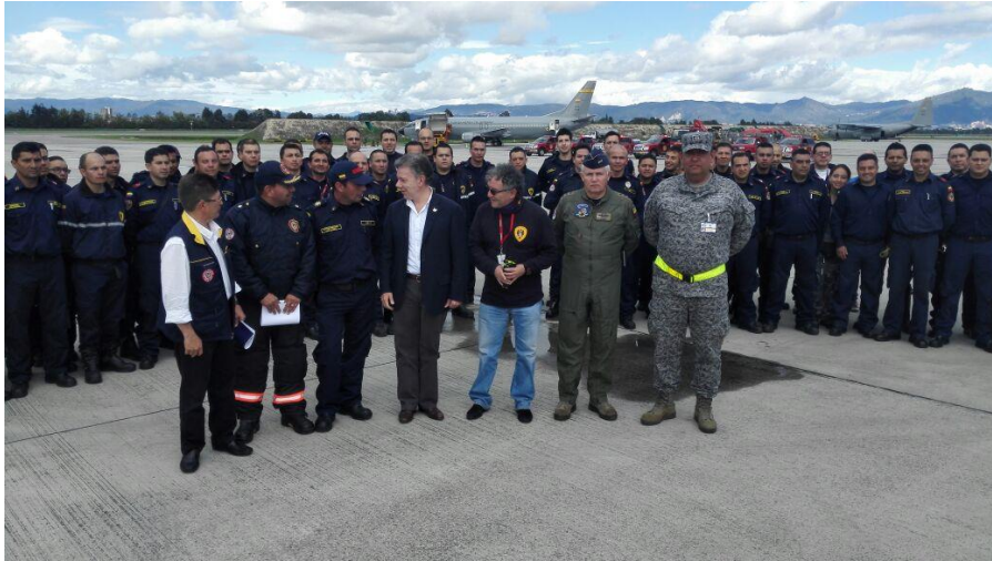
Imagen No 1 Movilización del equipo USAR COL-1 Base Aérea de CATAM, Bogotá Colombia

A las 7 pm, hizo arribo el equipo USAR COL1, a la ciudad de Manta Ecuador. Allí pasamos por migración y el Centro de Registro y Despacho "RDC" en cabeza de bomberos Quito, quienes nos asignaron a la ciudad de Portoviejo, iniciamos desplazamiento una vez nos suministraron camión y buses.