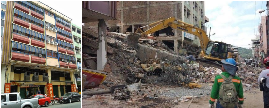
Imagen 7 y 8. Hotel el Gato, imagen izquierda antes – derecha después del sismo de 16 de abril.