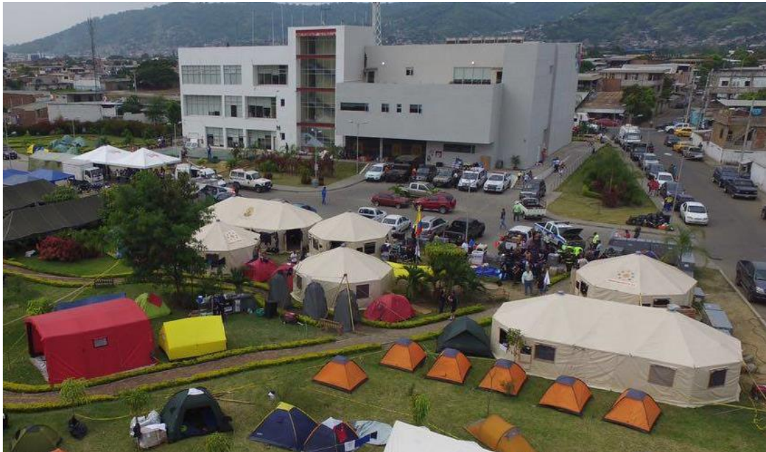
Imagen No 5 Base de Operaciones en ECU-911 Portoviejo

Se hizo instalación de la base de operaciones en un área adjunta al ECU-911 de Portoviejo, se instalaron las facilidades de Comando, Comunicaciones, Bienestar, Comedor, Alojamientos e Instalaciones Sanitarias.