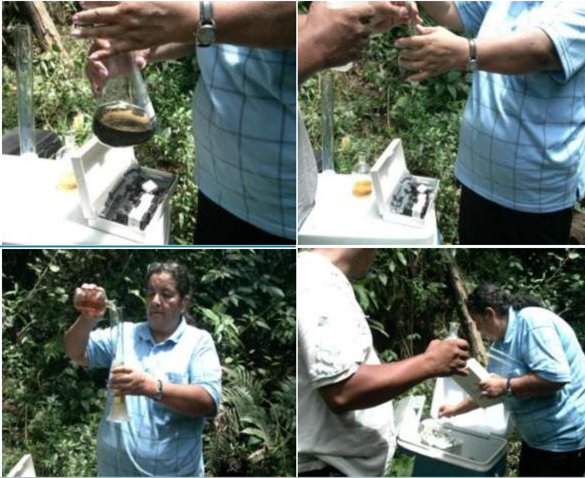
Figura 4. Procedimiento de aplicación de reactivos para determinar el DBO5 en la muestra de la parte alta del río Timaná