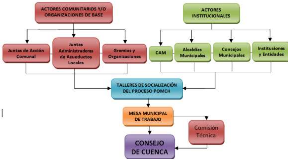
Figura 2. Esquema de articulación y participación ajustado, aceptado, concertado y avalado por los actores sociales de la cuenca