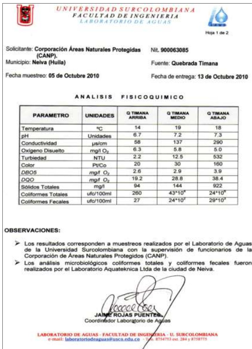
Figura 5. Resultados oficiales del estudio de calidad de agua