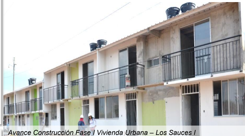
Avance Construcción Fase I Vivienda Urbana – Los Sauces I