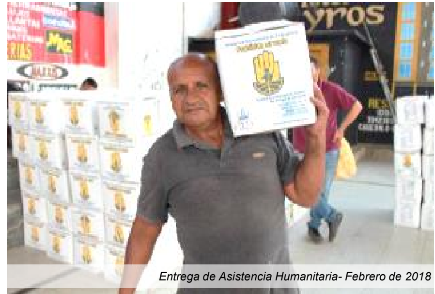
Entrega de Asistencia Humanitaria- Febrero de 2018

Se realiza la entrega la primera semana de cada mes.