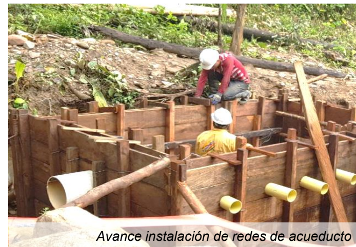
Avance instalación de redes de acueducto