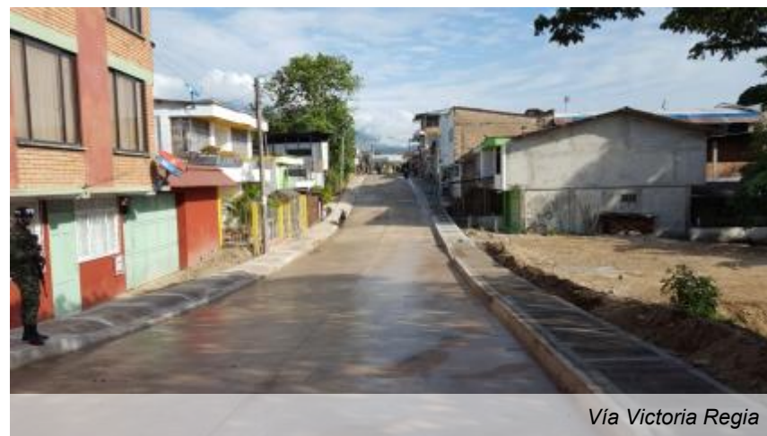
Vía Victoria Regia