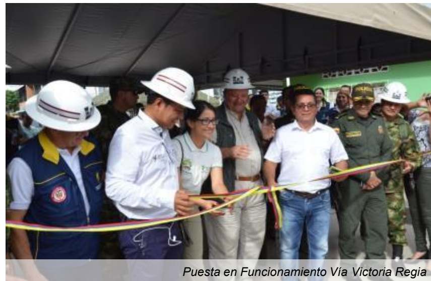
Puesta en Funcionamiento Vía Victoria Regia

Tiempo de ejecución: 18 meses (Octubre 2017 - Marzo 2019)