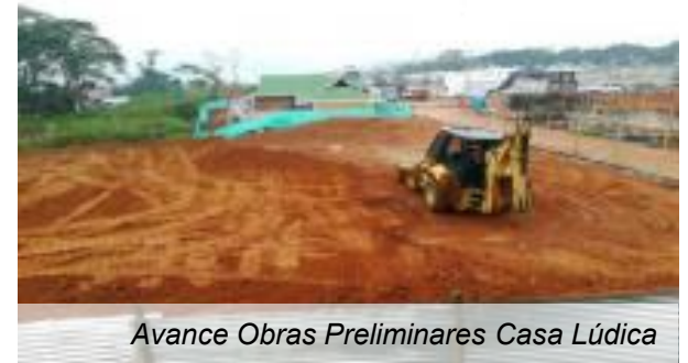
Avance Obras Preliminares Casa Lúdica