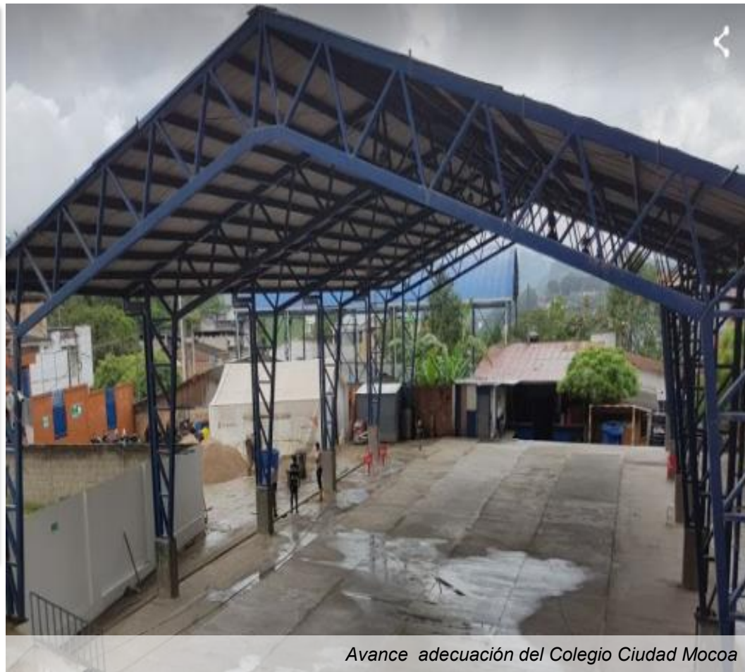
Avance adecuación del Colegio Ciudad Mocoa

Tiempo de ejecución: 3 meses (Enero-Marzo 2018)