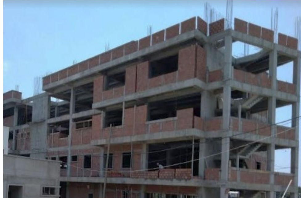
Avance Construcción del Hospital José María Hernández