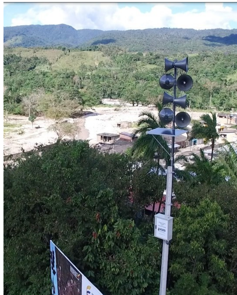
SAT terminado y entregado