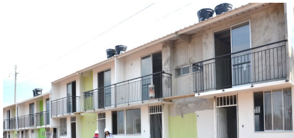
Avance Construcción Fase I Vivienda Urbana – Los Sauces I