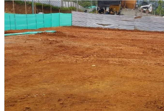
Avance Obras Preliminares Casa Lúdica