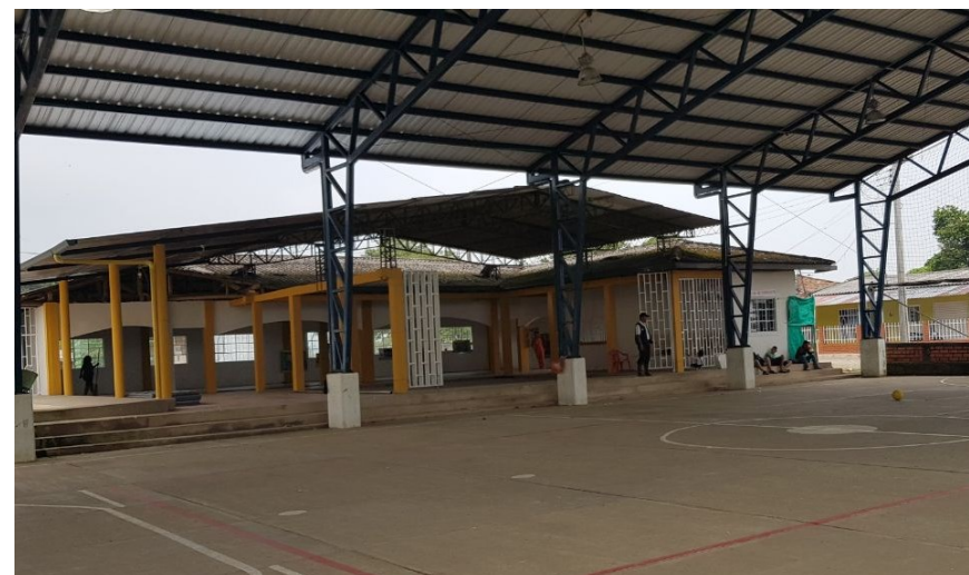
Cancha Deportiva el Pepino