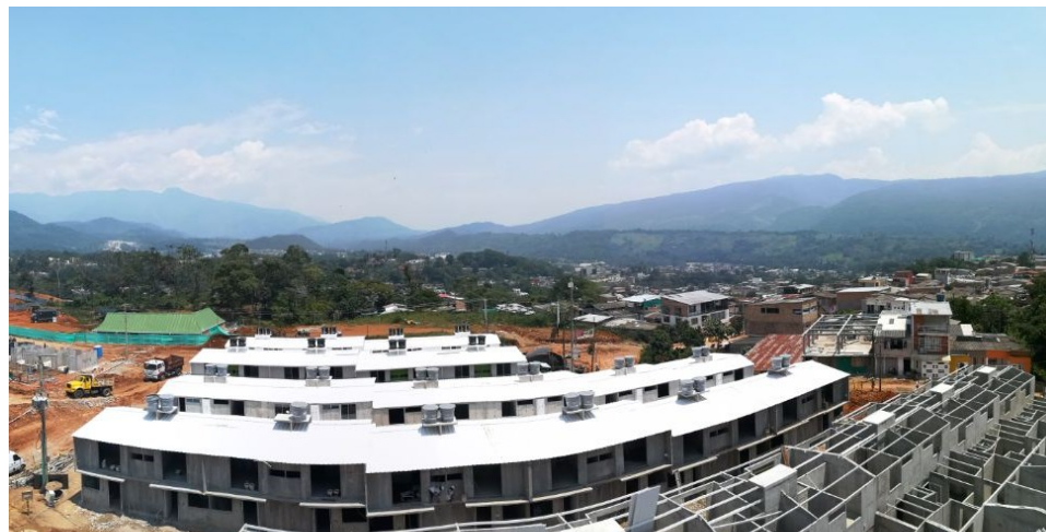
Avance Construcción Fase I Vivienda Urbana – Los Sauces I