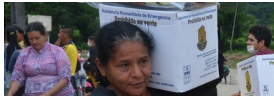
Asistencia Humanitaria de Emergencia