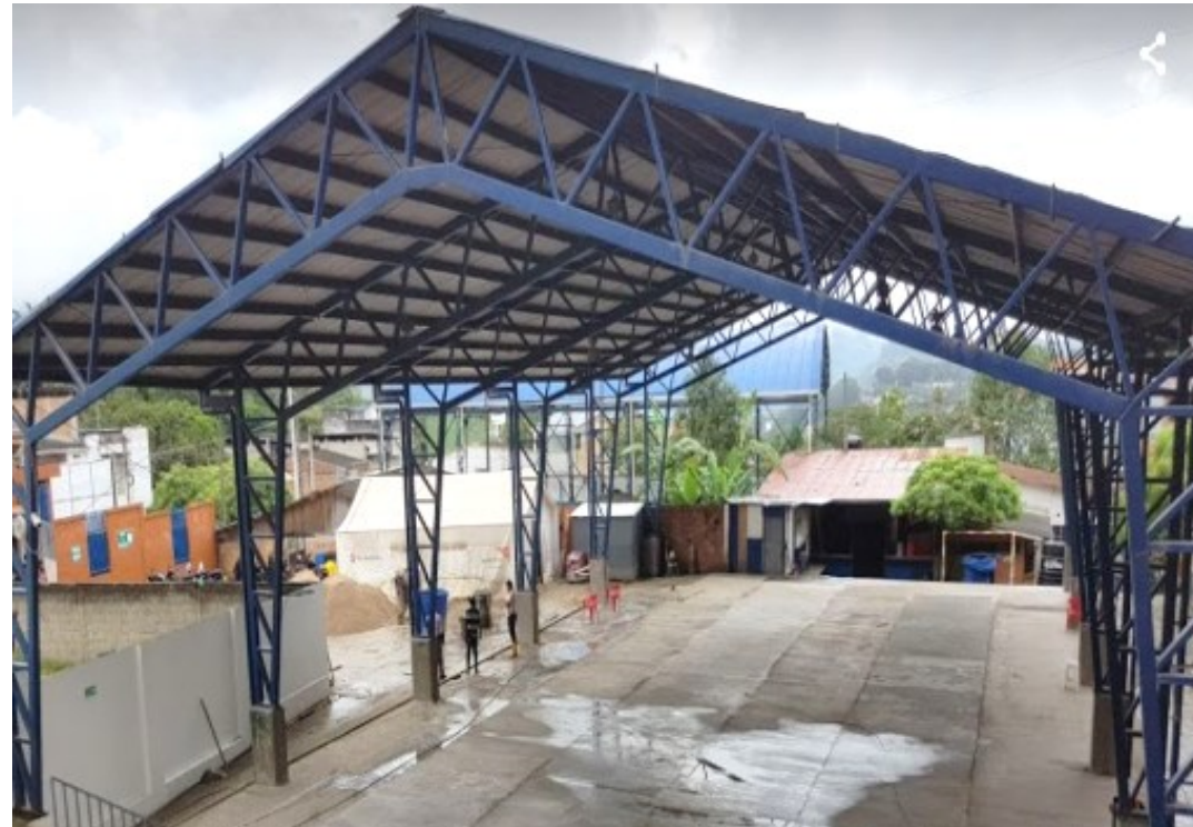
Avance adecuación del Colegio Ciudad Mocoa