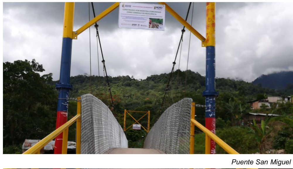
Puente San Miguel