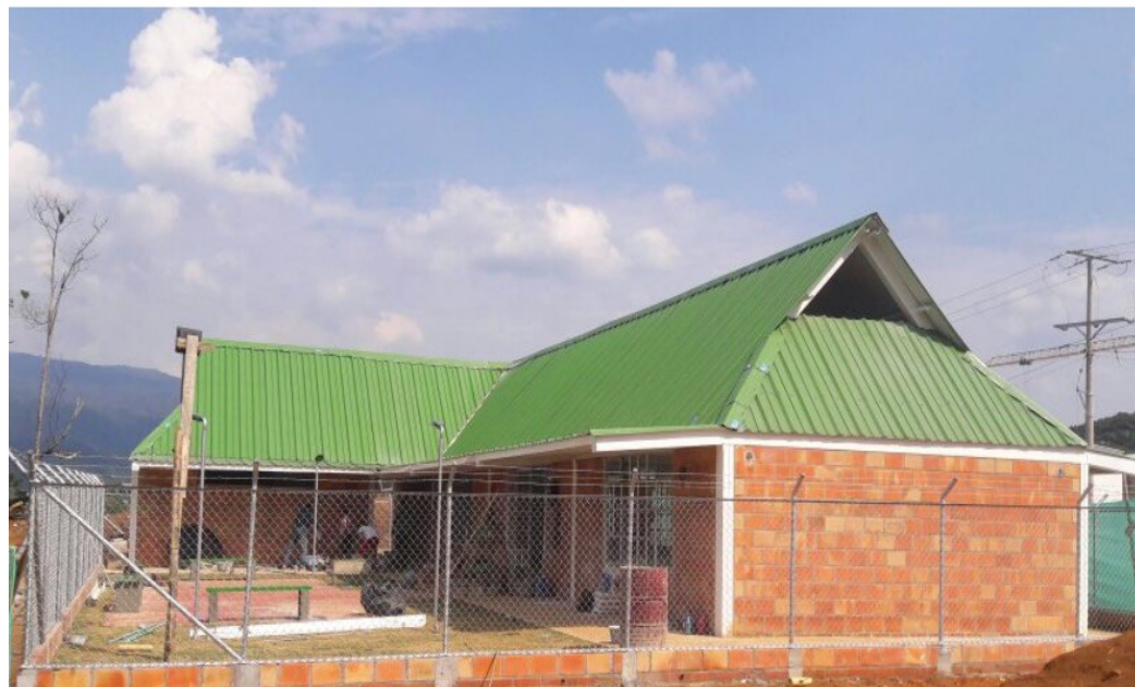
Avance construcción biblioteca