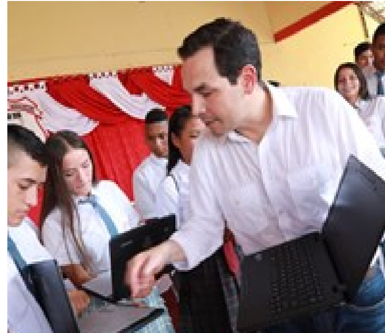
Entrega de Computadores para Educar