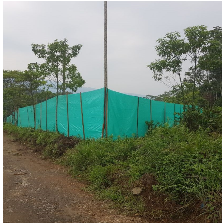
Predio Santa Mónica