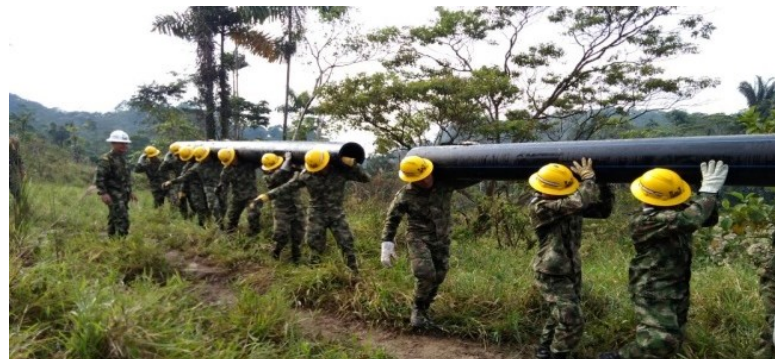
Transporte Materiales para Bocatoma Alterna