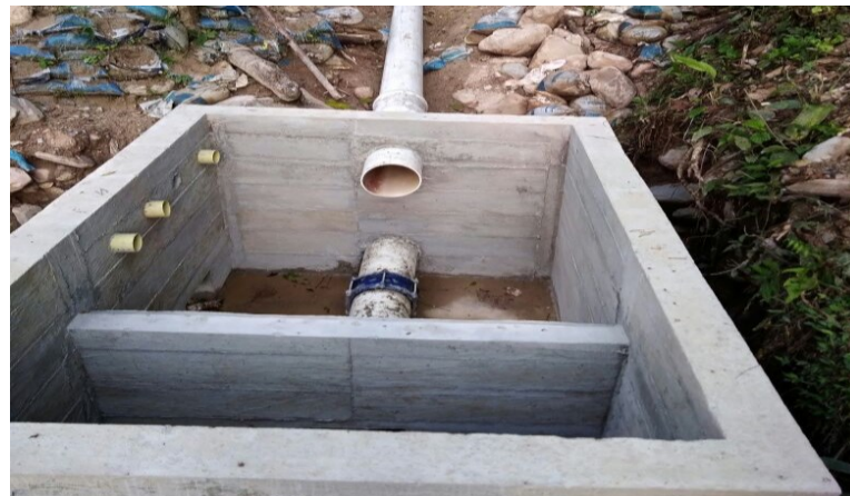
Bocatoma Alterna Terminada