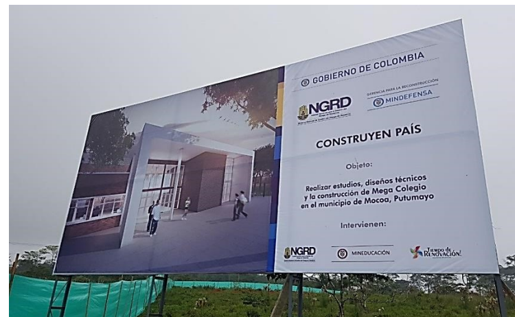
Área de Cesión Mega Colegio - Predio Sauces II