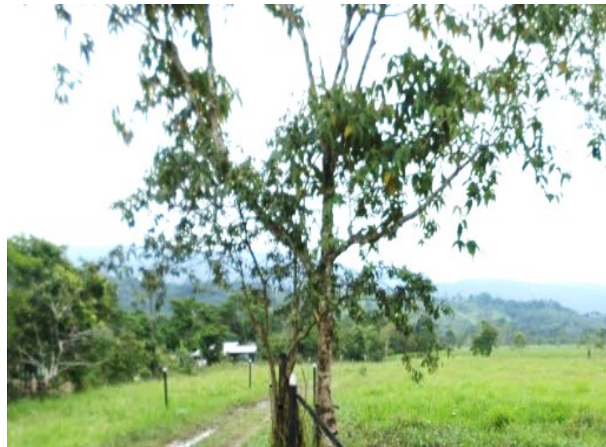
Predio – Los Recuerdos