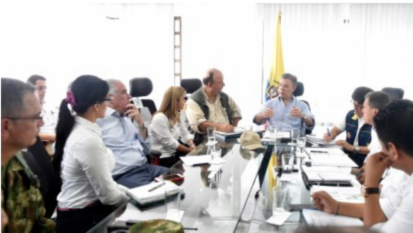
Puesto de Mando Unificado