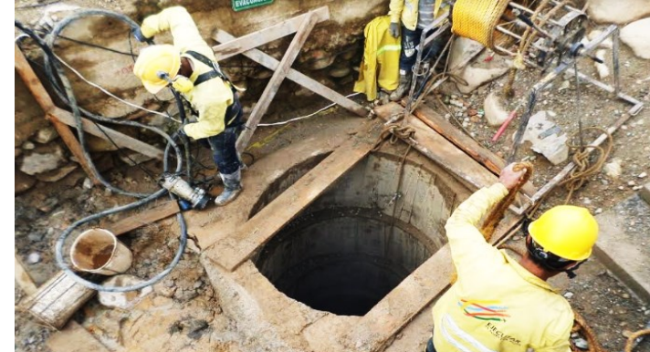
Avance Construcción Puente Vehicular Mulato