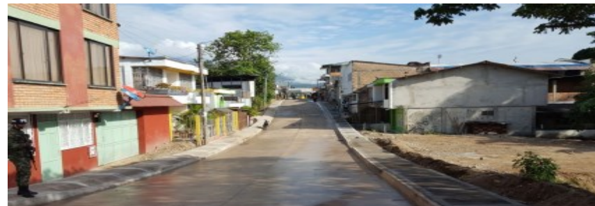
Vía Victoria Regia