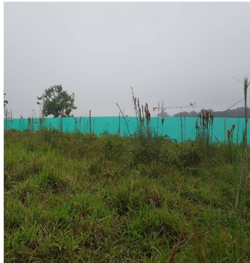
Predio - Sauces II