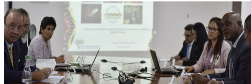
Mesa Técnica Ambiental – 13/02/2018