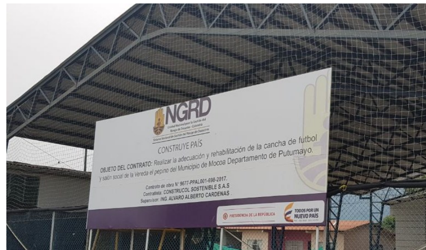
Cancha Deportiva el Pepino

✓ 100% terminado y listo para entrega oficial.