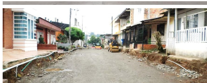
Avance intervención Vía Barrio Obrero