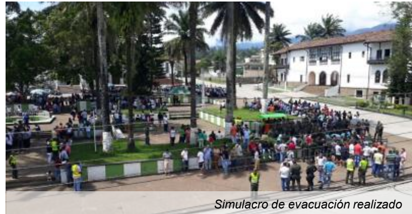
Simulacro de evacuación realizado