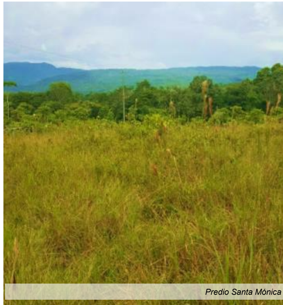
Predio Santa Mónica

Tiempo de ejecución: 2 años y 5 meses (Diciembre 2017 a Marzo de 2020)