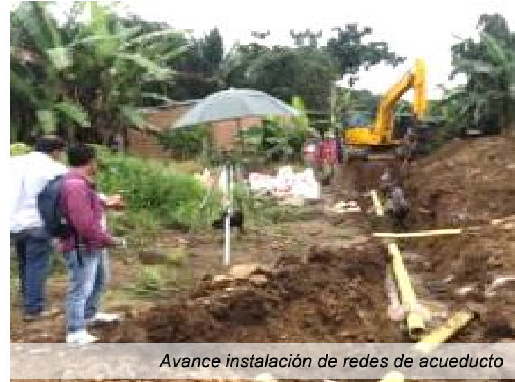
Avance instalación de redes de acueducto