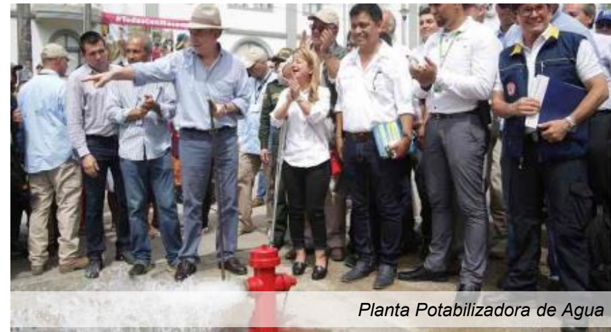
Planta Potabilizadora de Agua