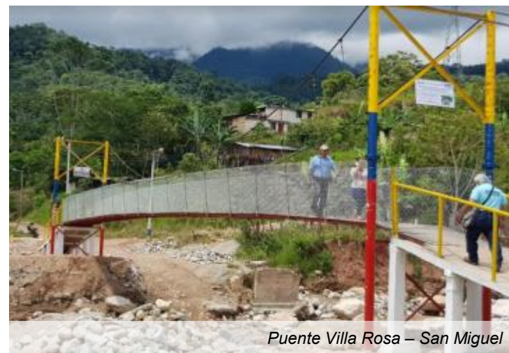
Puente Villa Rosa – San Miguel