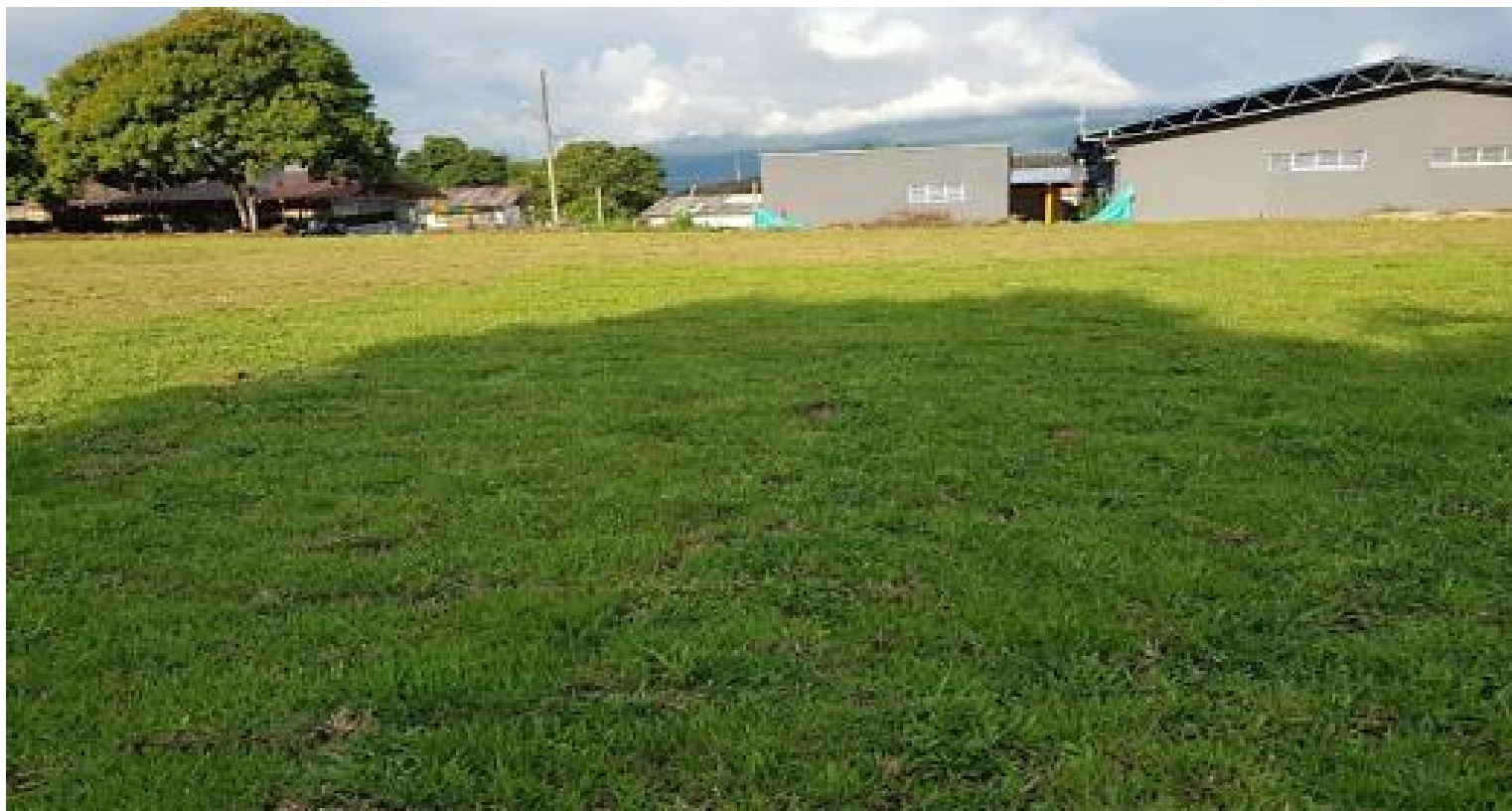
Cancha Deportiva el Pepino

3 meses (Septiembre 2017 a Diciembre 2017)