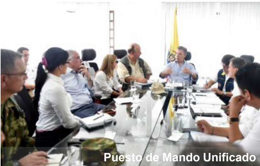
Puesto de Mando Unificado