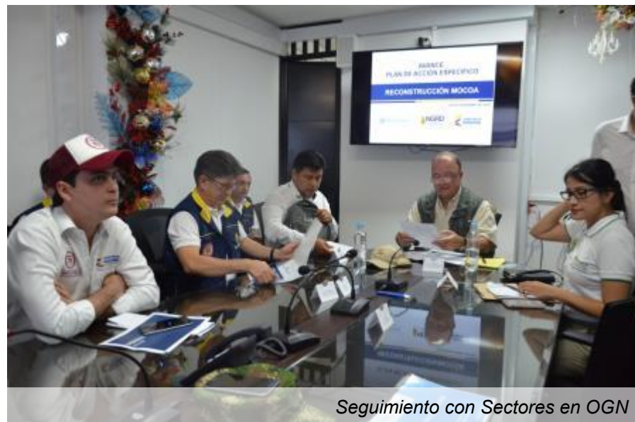
Seguimiento con Sectores en OGN