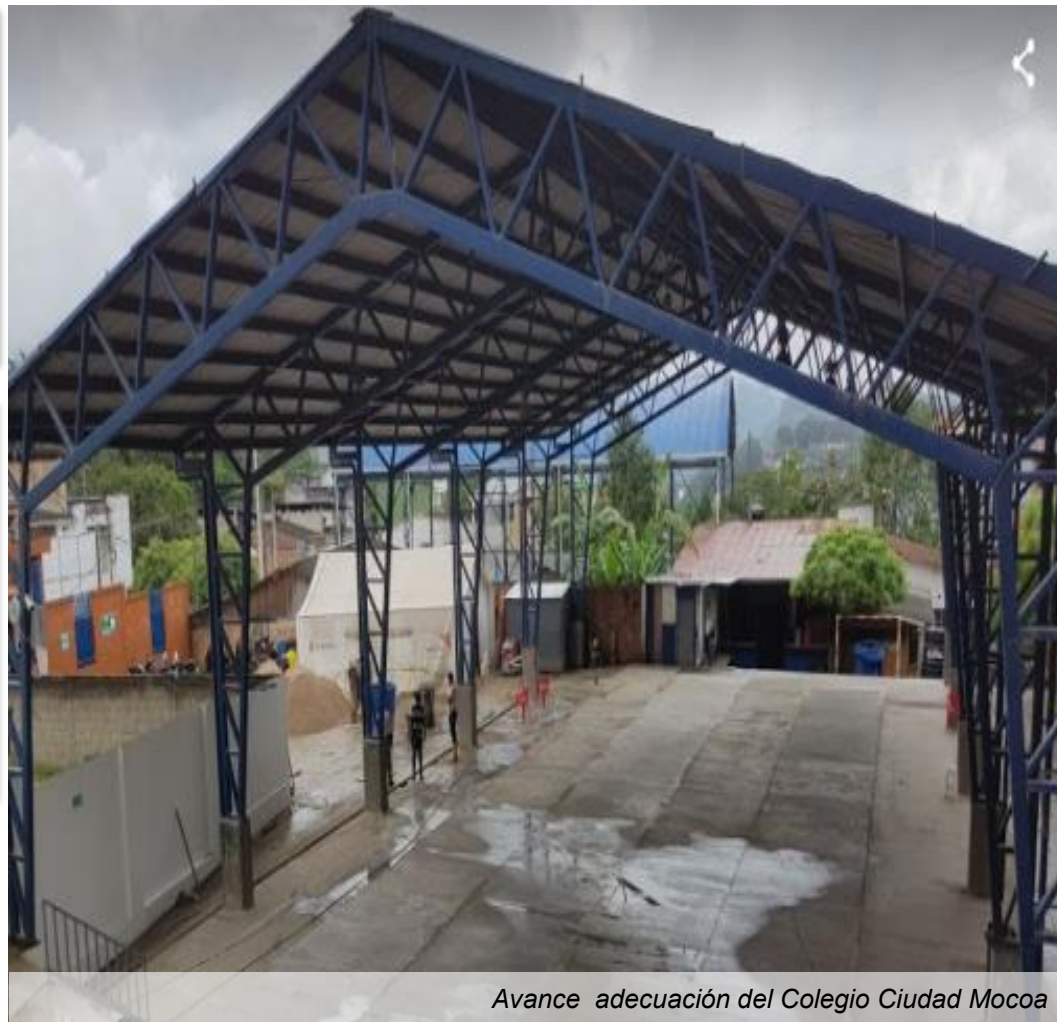
Avance adecuación del Colegio Ciudad Mocoa

Tiempo de ejecución: 3 meses (Enero-Marzo 2018)