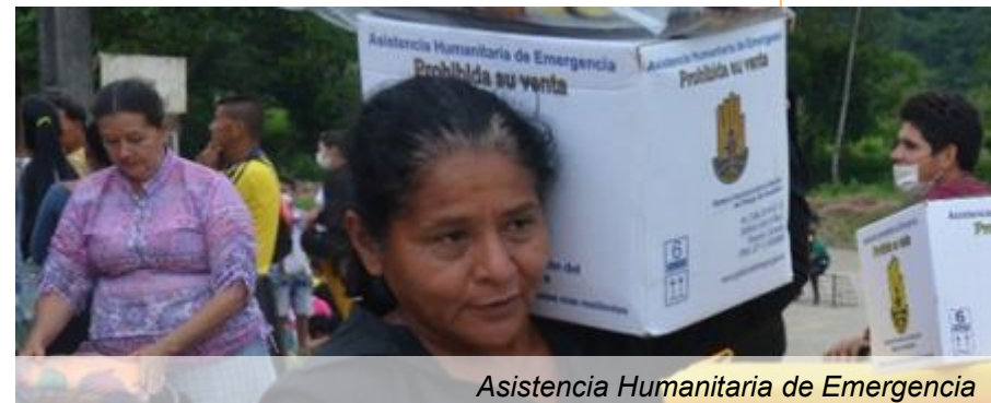
Asistencia Humanitaria de Emergencia

Restablecimiento de Telefonía y datos 100%