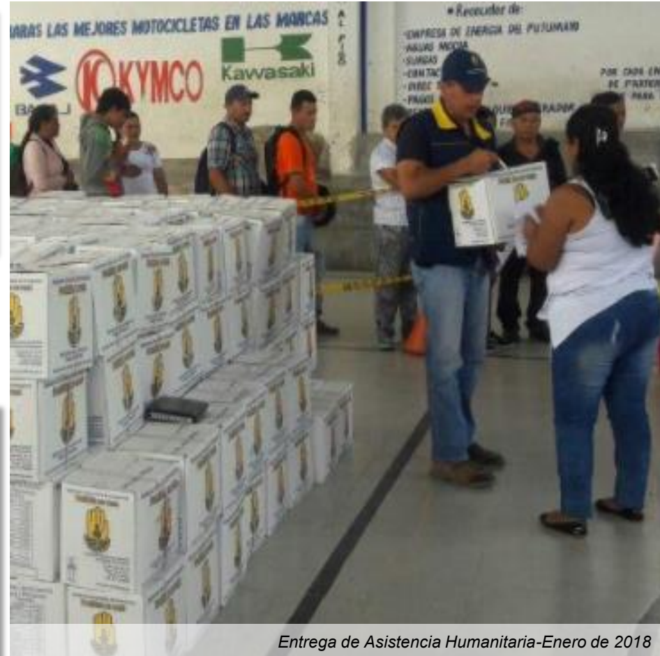
Entrega de Asistencia Humanitaria-Enero de 2018

Se realiza la entrega la primera semana de cada mes.