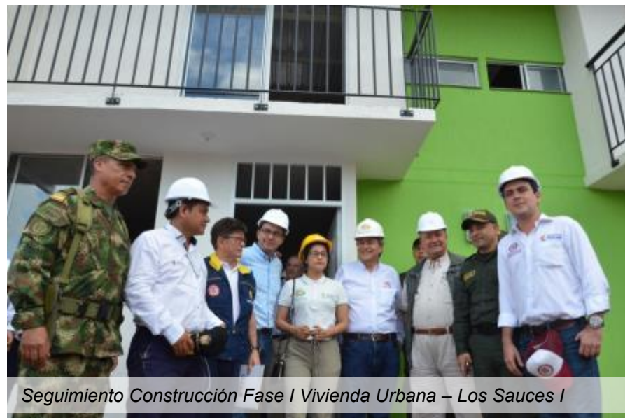
Seguimiento Construcción Fase I Vivienda Urbana – Los Sauces I