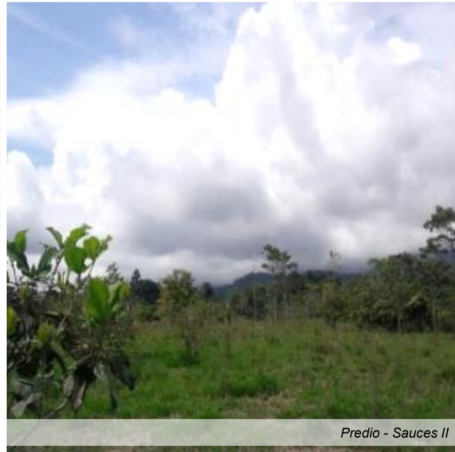
Predio - Sauces II