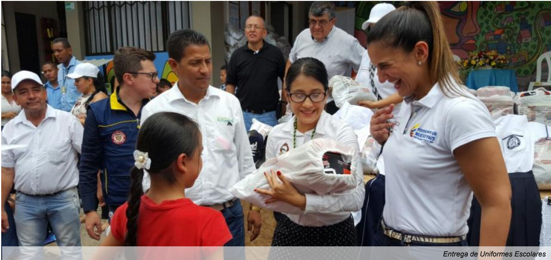
Entrega de Uniformes Escolares