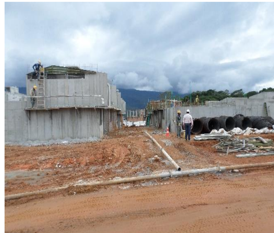
Avance de construcción Fase I Vivienda Urbana – Los Sauces I

Tiempo de ejecución: 1 año (Mayo 2017- Mayo 2018)