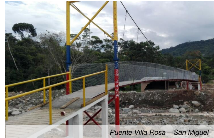
Puente Villa Rosa – San Miguel