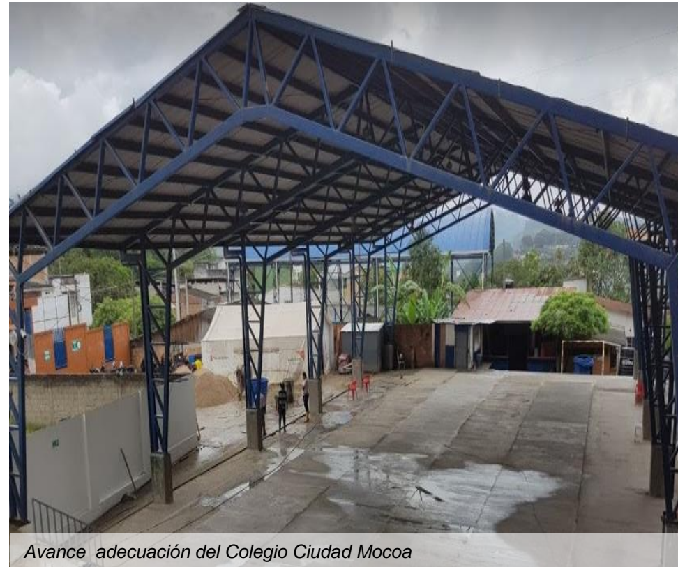
Avance adecuación del Colegio Ciudad Mocoa