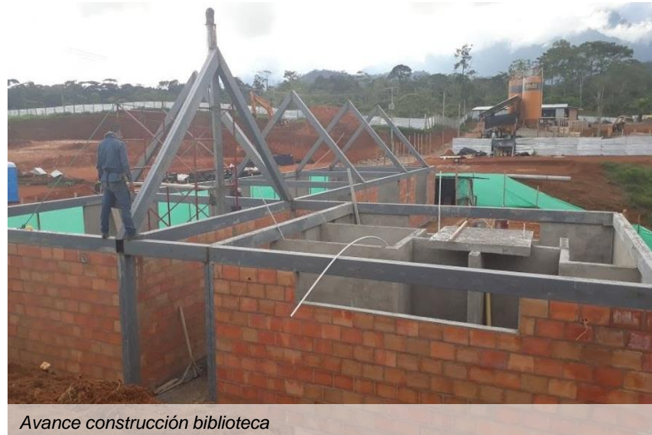
Avance construcción biblioteca