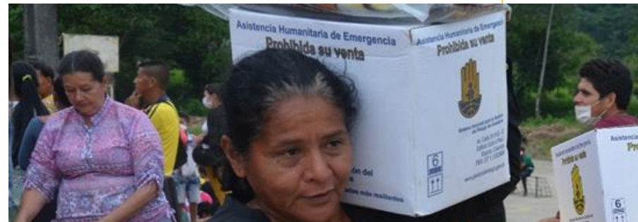
Asistencia Humanitaria de Emergencia

Restablecimiento de Telefonía y datos 100%