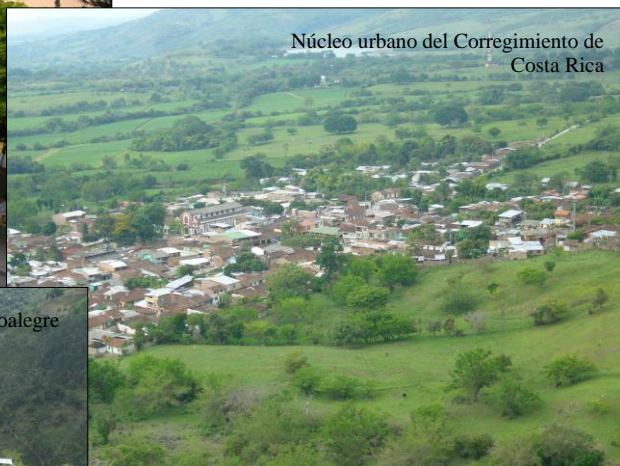
Núcleo urbano del Corregimiento de Costa Rica