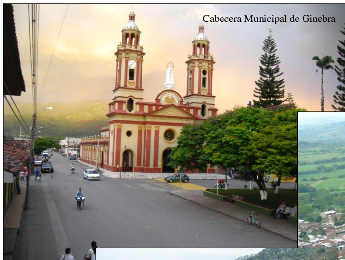
Cabecera Municipal de Ginebra

Plan Municipal para la gestión del riesgo