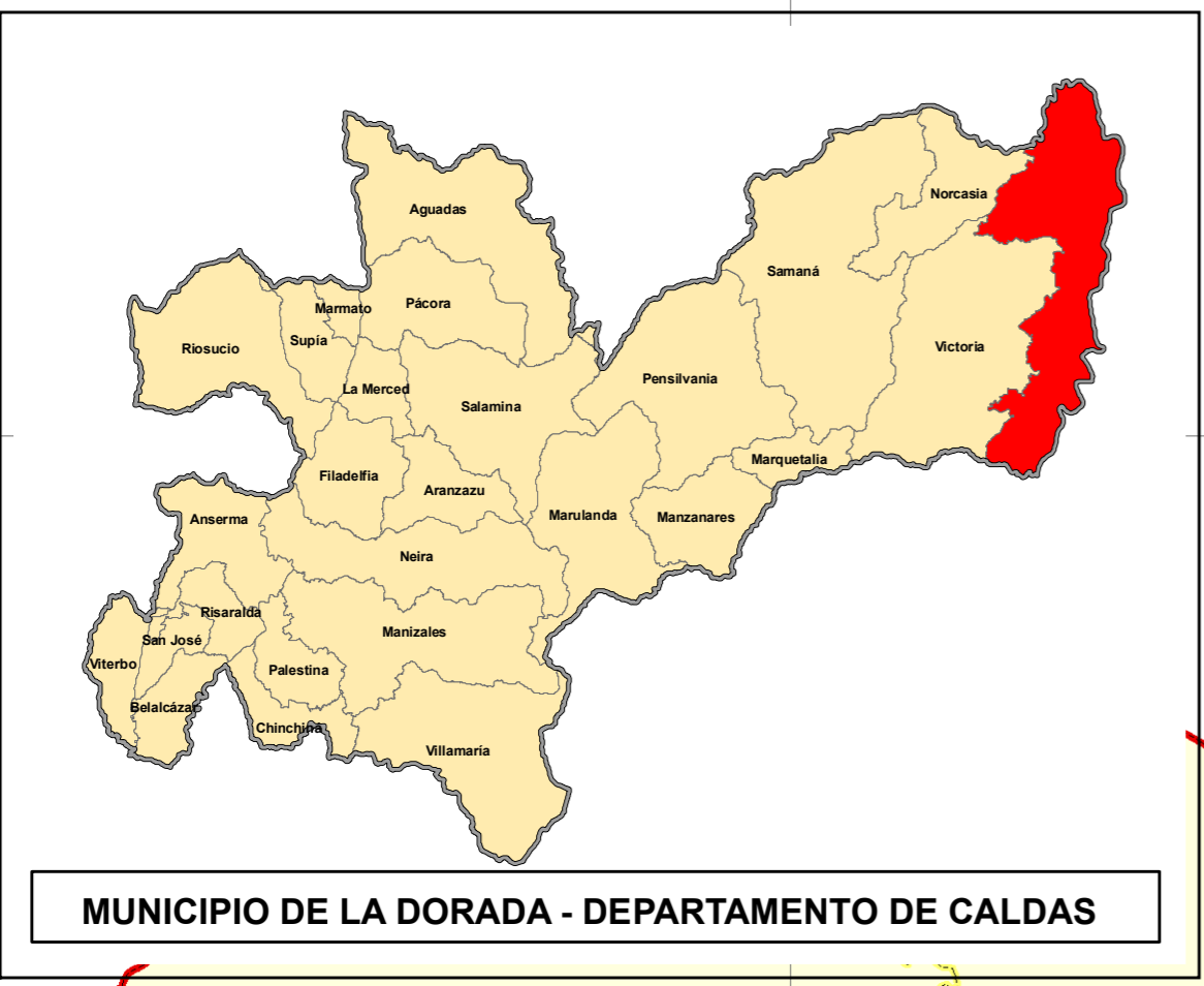
MUNICIPIO DE LA DORADA - DEPARTAMENTO DE CALDAS